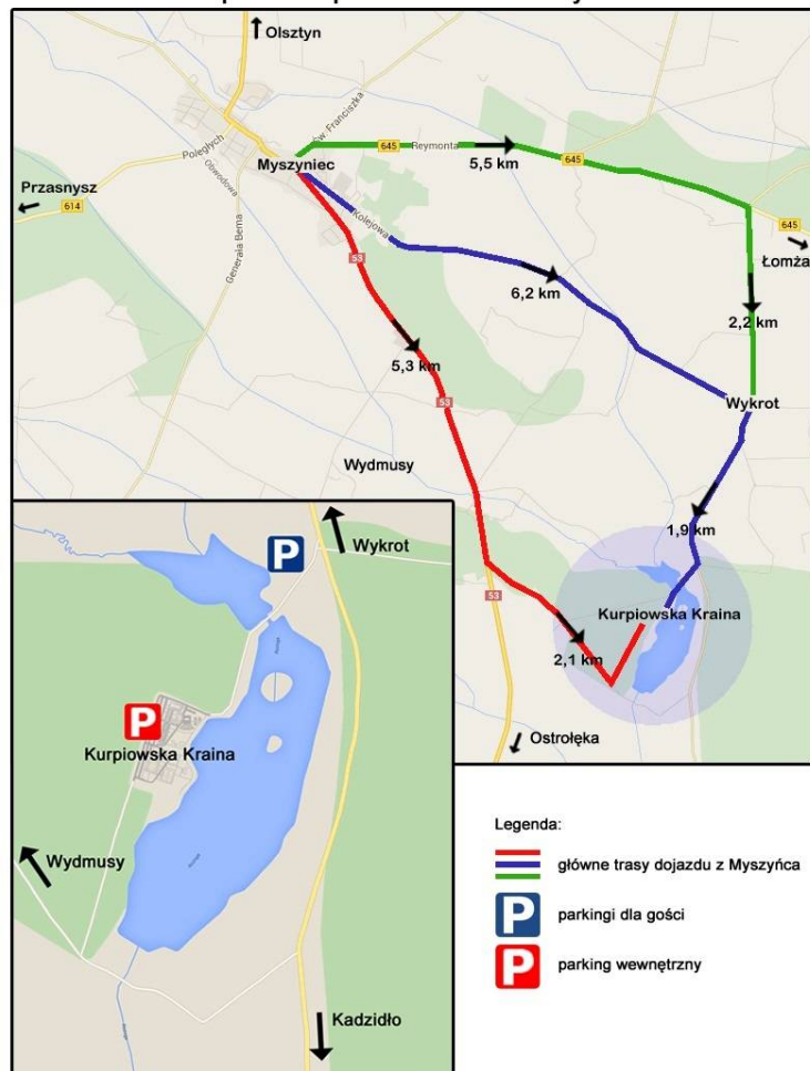
Mapa dojazdu XXXIX Miodobranie Kurpiowskie Kompleks Kurpiowska Kraina w Wykrocie

Dla niezmotywowanych gości zostanie zorganizowany odpłatny transport (4,50 zł) na trasie Myszyniec- Wykrot (kompleks) – Myszyniec. Autobusy będą kursować w niedzielę z dworca autobusowego, co 30 min. od godz. 10:30 do godz. 22:30 (powrót z Wykrotu od godz. 11.00 do 23.00)