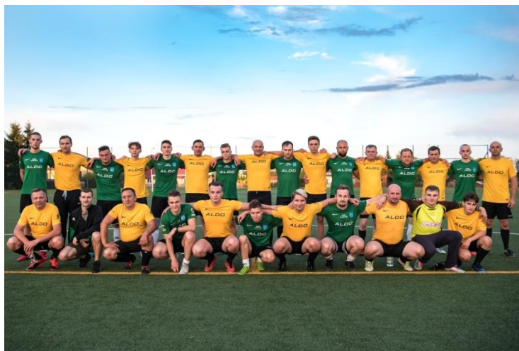
Zdjęcie z meczu towarzyskiego z ALDO

Sponsorzy/Partnerzy klubu ALDO Bartnik Myszyniec: Gmina Myszyniec, ALDO, Przewozy krajowe i międzynarodowe "EMAR", Groszek u Krajzy, Zajazd u Dzikka.